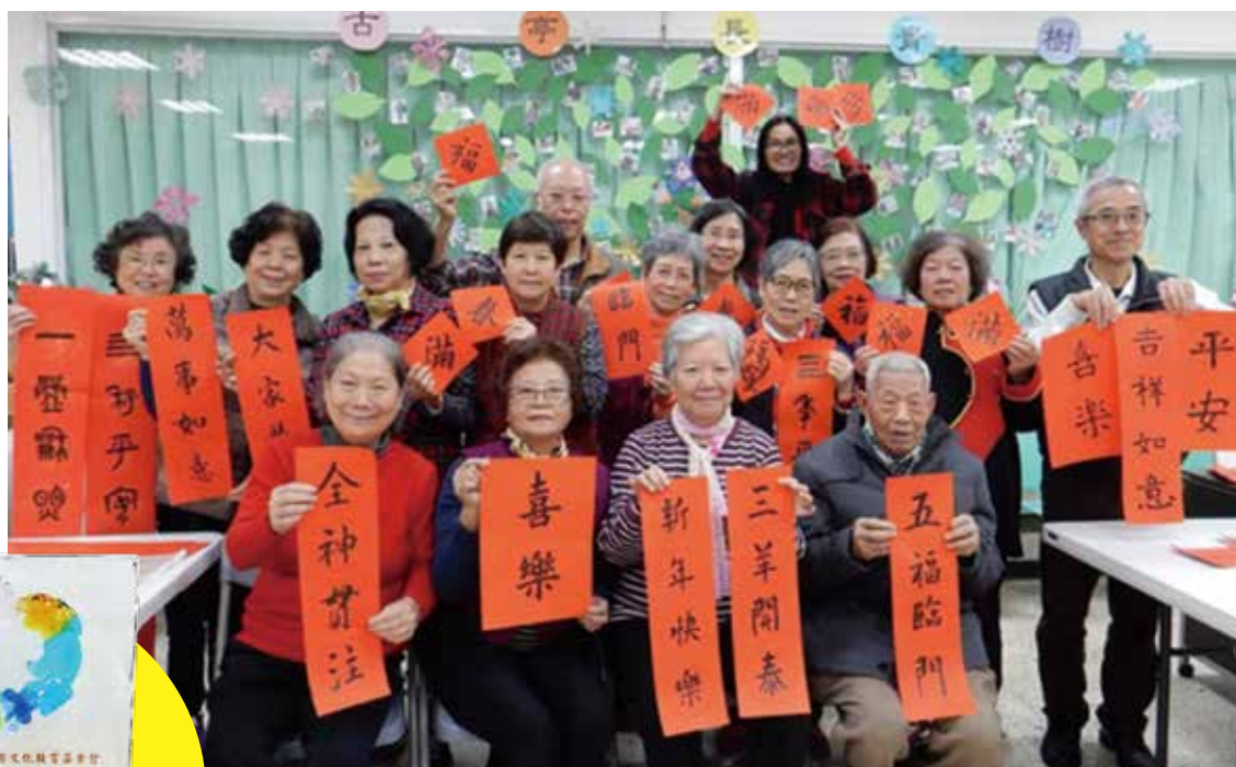
◀ ▲ 環宇古亭據點，得到台北市衛生局及社會的肯定，以方案優異的表現，榮獲「卓越獎」。

長照與安養機構的使用率均達六至七成，其中失智照顧型機構因需求量龐大，但專門的失智照顧型機構只有一家，所以使用率近 90%，隨著高齡化日趨嚴重，可見社會對有關機構的需求龐大。加上在 2014 年，全台灣長照與安養機構的數量比 2009 年時下降近 2%，與整體社會現實不符，可見政府應該在市場上發揮影響力，通過政策鼓勵新的長照機構落成，以因應高齡少子化帶來的沉重養護負擔。