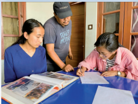
▲新董事成員簽署相關文件