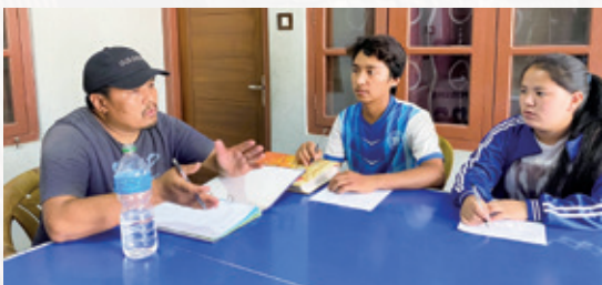
▲新董事成員參訪育幼院，聆聽董事長說明組織運作

他們翻閱著育幼院的歷史相冊，仔細聆聽董事長暨院長 DM 先生介紹過去、現在的服務成果，以及未來的工作計畫，每一雙眼睛都閃閃發亮。此刻，他們被正式邀請，即將成為雪巴育幼院第二屆的新任董事，每個人內心都懷抱著無比的喜悅與遠大的夢想！