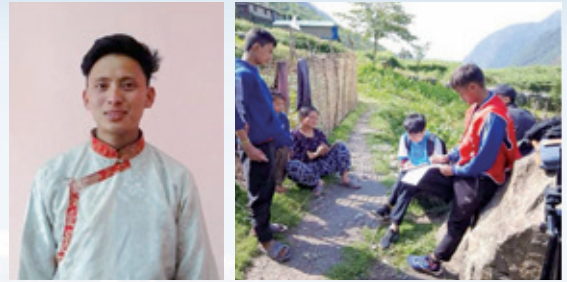
▲拉帕品學兼優，今年擔任返鄉志工 (中)，正在協助進行家訪工作