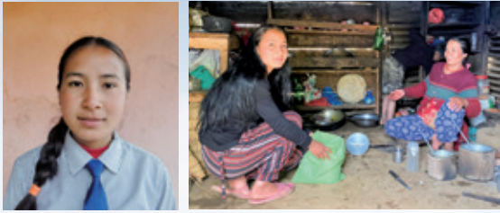
▲帕西乖巧懂事，平時幫母親務農、畜牧、汲水、做飯等家務