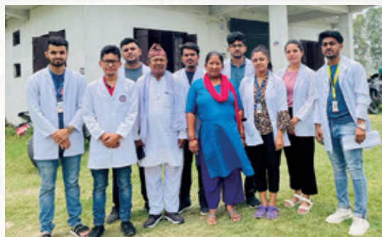
▲最近他到鄉下醫院與公衛單位做研究 (左二)