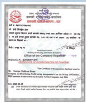
▲雪巴育幼院在尼泊爾註冊登記證書