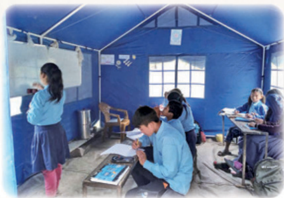
▲ 搭建帳篷做為 7 年級學生的臨時教室，這是他們上課的情形

學校現在已經增設 6 年級、7 年級，這對村民和學生都是非常大的鼓舞。但同時，我們也面臨新的問題，因為全校共只有 3 間教室，原本教室就不足，當核准增設 6 年級時，學校只能讓兩個年級學生，使用同一間教室上課。