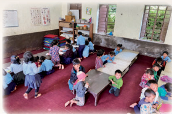
▲1 年級學生和 2 年級學生，共用一個教室，這是他們上課的情形

所以，有些父母帶著孩子離開村子，赴印度打工，夢想著能建立更美好的未來。有些父母則把孩子送到其他能免費提供食宿教育的機構，比如寺院或城市的兒童之家。有一些學生要離開村莊時哭了，由於家庭貧困，他們無法留在自己的家鄉讀書。我祈禱這些離開的孩子們，無論去那裡，都能過更好的生活，並接受良好的教育。