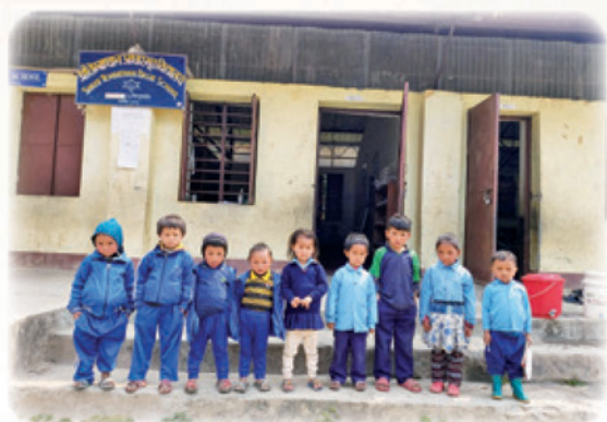
▲這是 1 年級生，年紀約 3、4 歲，他們會重複讀 1 年級，直到可以升 2 年級為止

現在所有村民都非常高興，因為學校從去年開始獲得增設 6 年級，今年剛通過增設 7 年級。未來我們計劃努力一直往上增設更高的年級，甚至可以到達 8 年級，這樣孩子就可以不用離鄉就能上學。