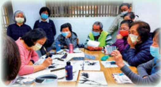
學員專注欣賞老師的水墨花鳥創作