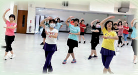
土風舞優美的韻律舞步美化身心