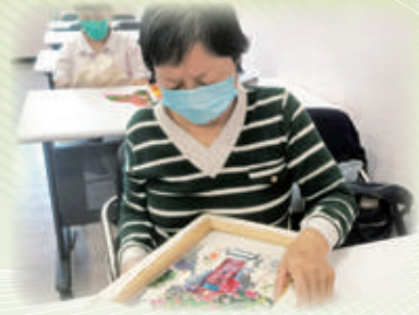
指尖魔術手作花隨玉指展現刺繡之美