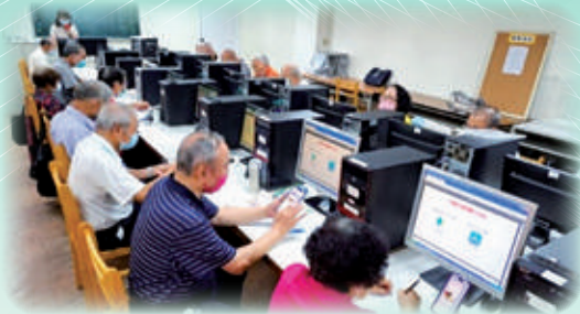
手機電腦生活班在 play 商店尋找 APP 應用