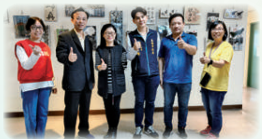
靜態成果展展現婦女豐富的作品成果