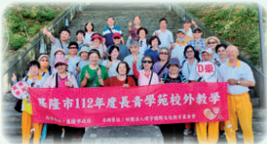
校外教學拓展視野，舒展身心