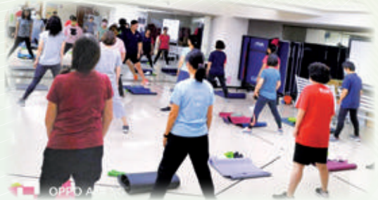
肌力瑜珈課程強化核心肌力