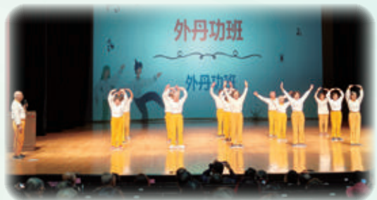
外丹功班在動態成果展中展現練習功法