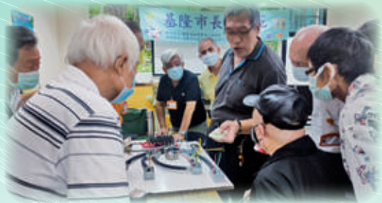
長者在水電維修課程中仔細聆聽老師說明