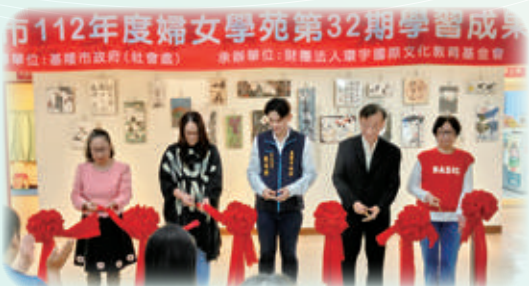
市府秘書出席靜態成果展開幕式