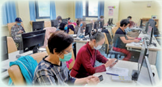
婦女運用智慧手機落實便利生活