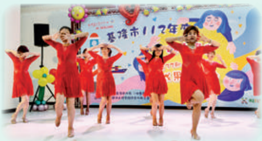
活力拉丁舞展現美麗與自信的精采舞姿