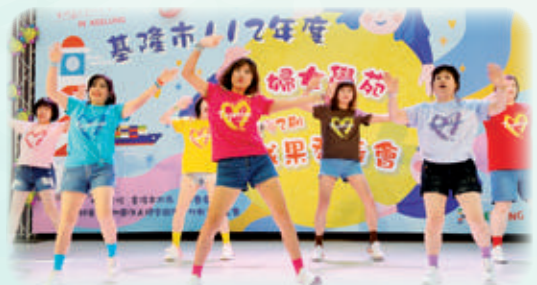
律動舞蹈流露出青春無敵與健康年輕