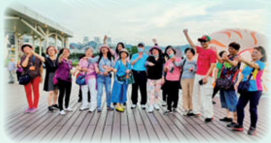
外展課程「與鯨鯊共游」學員開心樂活