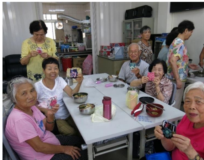
台中愛心廚房供餐