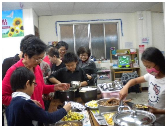
課輔兒少也來協助打菜