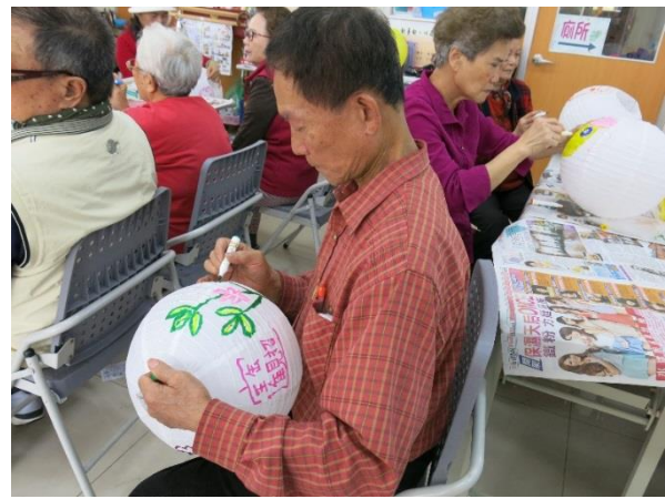
節慶活動-元宵節燈籠彩繪