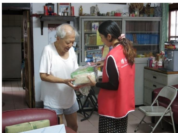
連結食物銀行的物資，也會在每次關懷訪視時，發送給長輩