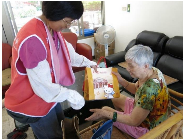
如遇到連續假日，也會發送替代餐