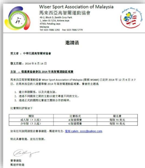
馬來西亞比賽邀請函