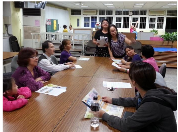
林興里據點-親師座談會