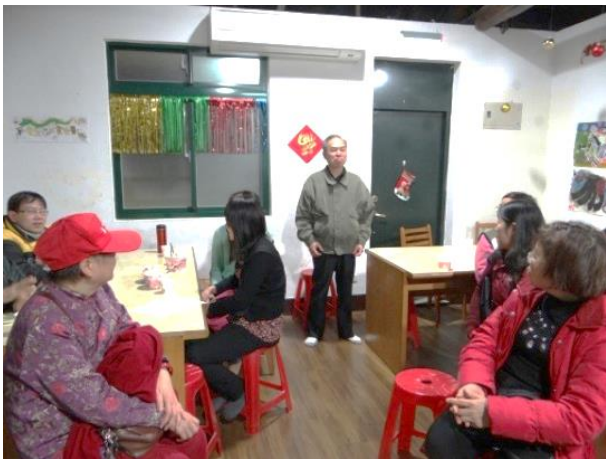
南機場據點-親師座談會

(二)服務內容：依據家長需求設計親職教育講座之主題，提供家長親職功能及親職教育等觀念，教導家長輔導技巧、對孩子教養之基礎理論。依據課輔班學生學習表現設定討論主題，除提升家長知識及觀念外，更透過與輔導老師及社工溝通，了解學童於據點接受服務之情形，進而增強親子關係。