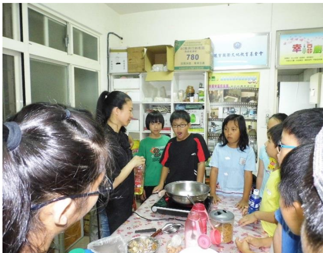
南機場愛心廚房教學

(二)服務內容：運用據點內建構愛心廚房，進而可以提供兒少、老人等服務對象共餐及送餐等服務。