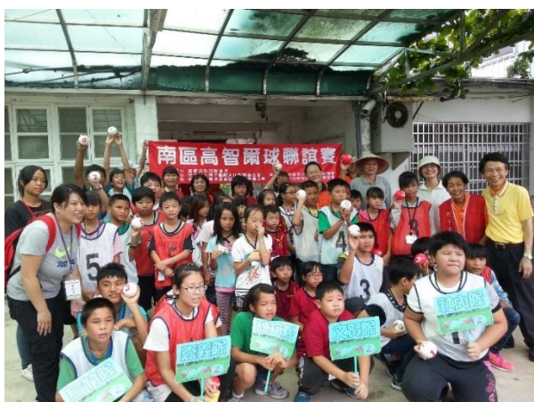
台中據點-高智爾球大會師