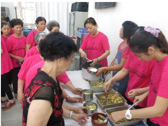
大家一起用餐打菜