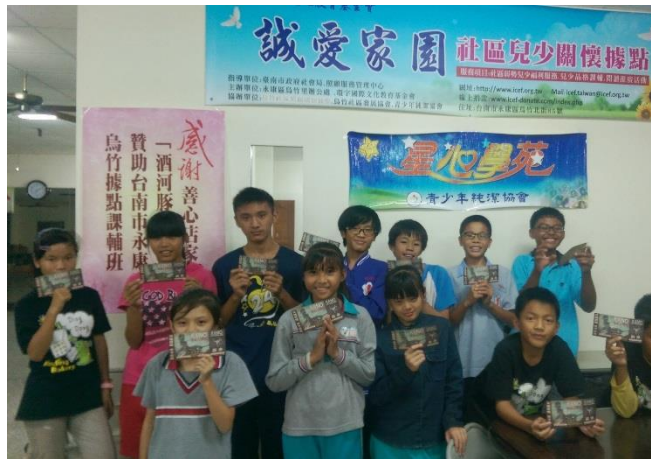
課輔活動-善心人士捐贈電影票