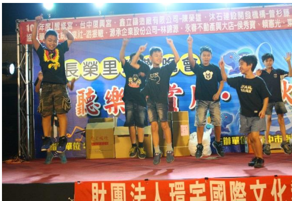
節慶活動-中秋節聯歡晚會