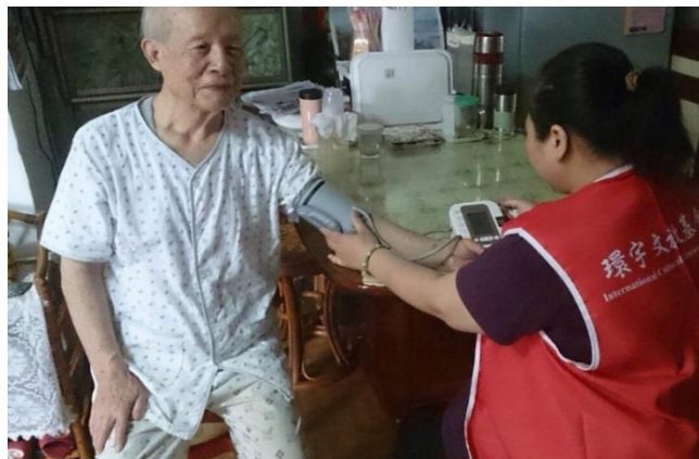
量血壓、聊天陪伴，了解長輩需求以立於社工資源連結