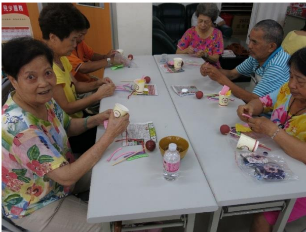
靜態活動-手工藝製作