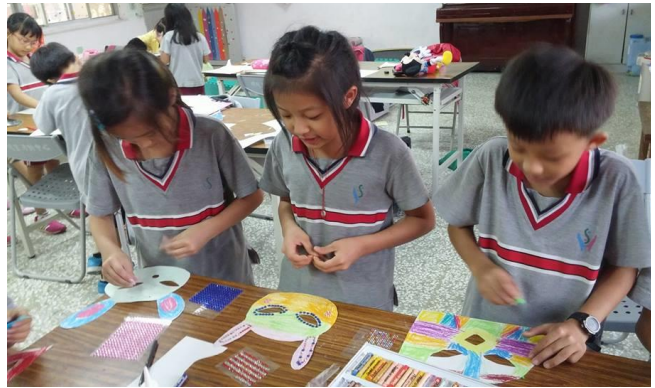
課輔活動-製作面具