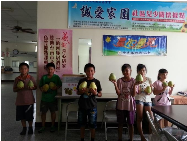
節慶活動-中秋節獲得柚子

(二)服務內容：與社區一起配合節慶時間，舉辦相對應活動，使社區老少皆能歡欣度過。