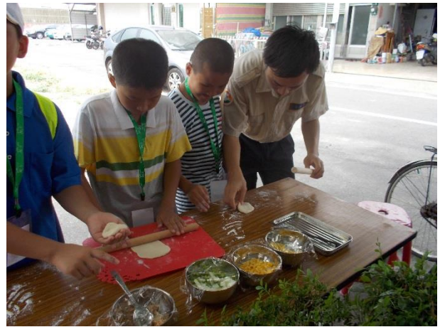
營隊活動-披薩製作