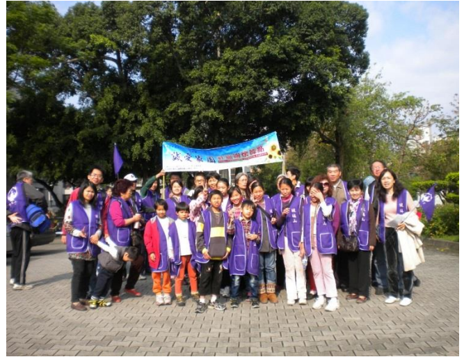
台中據點-親子活動