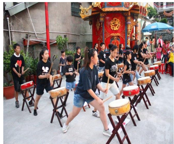
節慶活動-太鼓表演