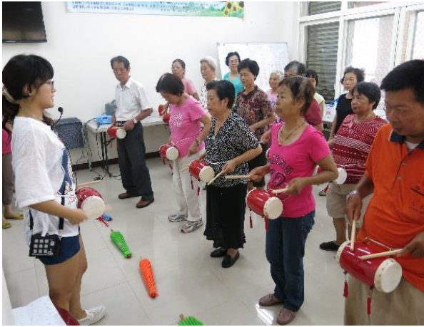
動態活動-樂器打擊

(二)服務內容：藉由多元化的健康促進活動讓長輩，不只可以動動手腦外還可以在活動中達到社會參與、人際互動，也會在活動的簽到表中注意長輩的出席狀況，如一週沒有到機構參與活動時會以電話聯繫長輩情況。