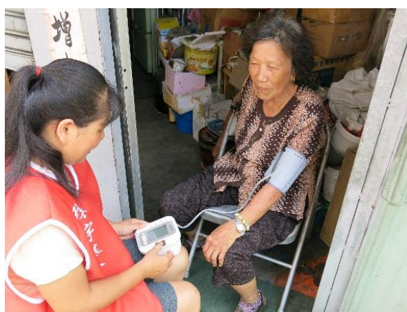
到府協助長輩測量血壓