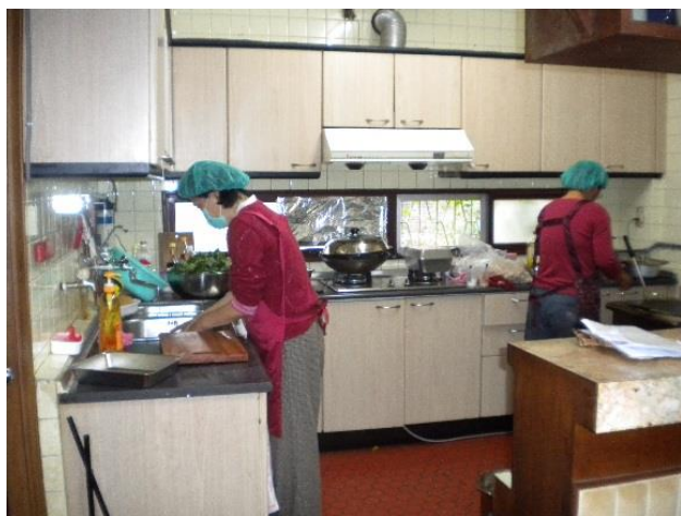
台中愛心廚房聘請有執照廚師烹煮