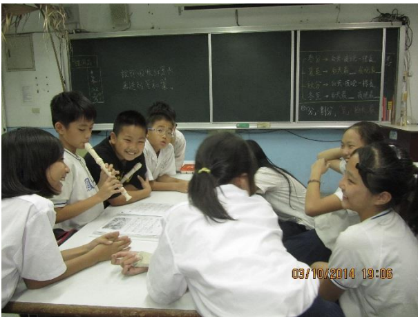
課輔活動-練習直笛