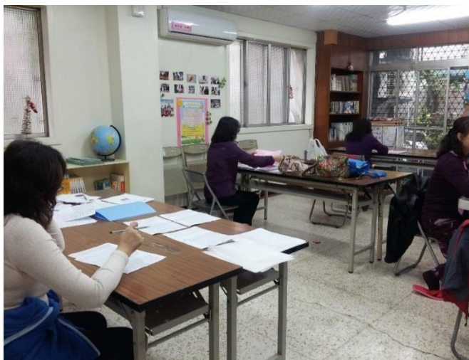
志工執行電話問安業務實況