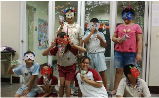
課輔活動-面具呈現

(二)服務內容：每周一至五於學校下課後辦理課後輔導班，聘請國中小課輔老師各 1 名，輔導完成學習作業、培養學習態度、帶動讀書之風氣，並提供學習弱後之同學補救教學；由社區愛心廚房提供晚餐，制定生活及學習規範激勵孩童自律及提升生活自理能力。