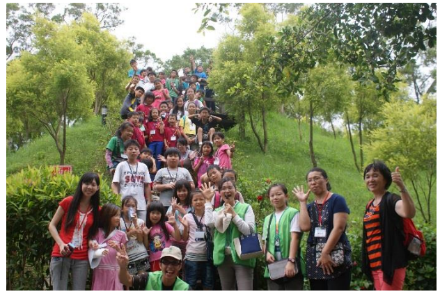
營隊活動-社區導覽