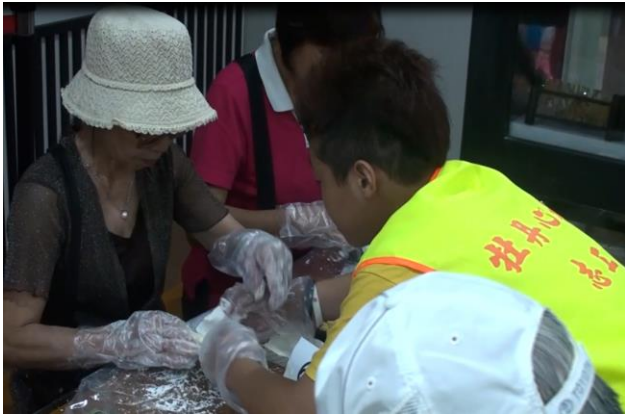
兒老一起參與手工DIY