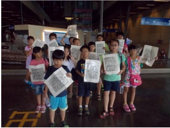
營隊活動-至台灣歷史博物館參觀