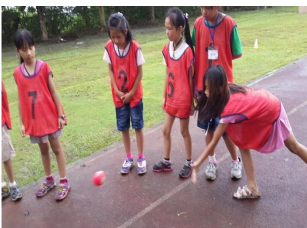
台中據點-先禮後兵