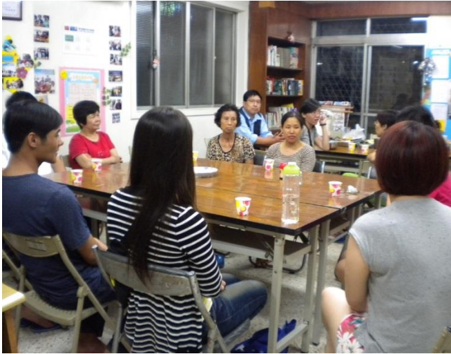
台中據點-親師座談會