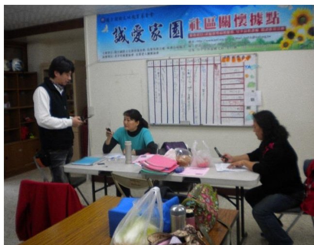
業務執行完畢，討論個案狀況