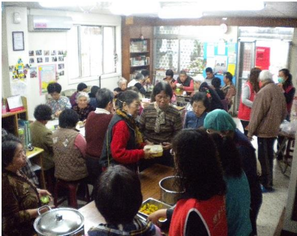
每週 2 次共餐

(二)服務內容：藉由餐飲服務能夠協助社區長者、獨居老人及邊緣戶，餐飲服務補充日常營養，安定老人生活，並由廚師營養師針對長者身體狀況、需求協助配餐。