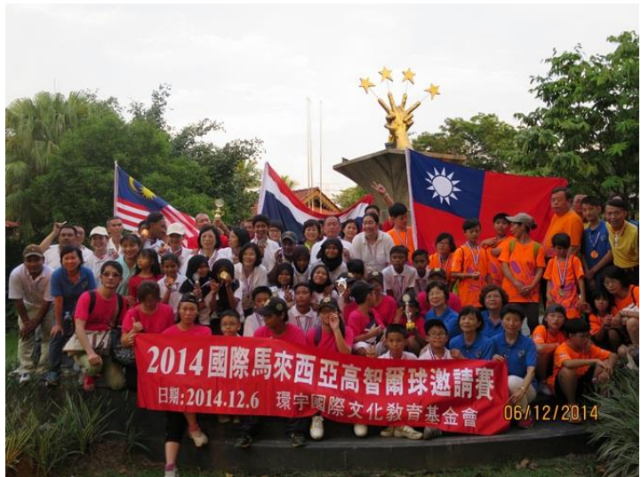
比賽結束後，全部球員大合照