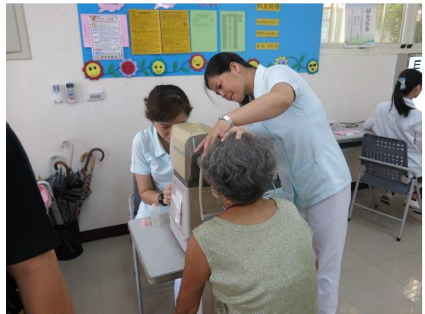
靜態活動-醫療保健