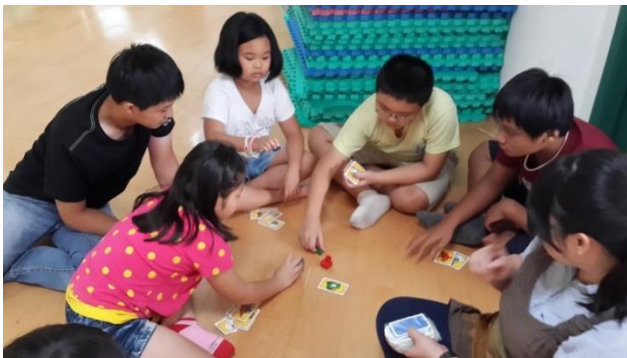
營隊活動-桌上遊戲