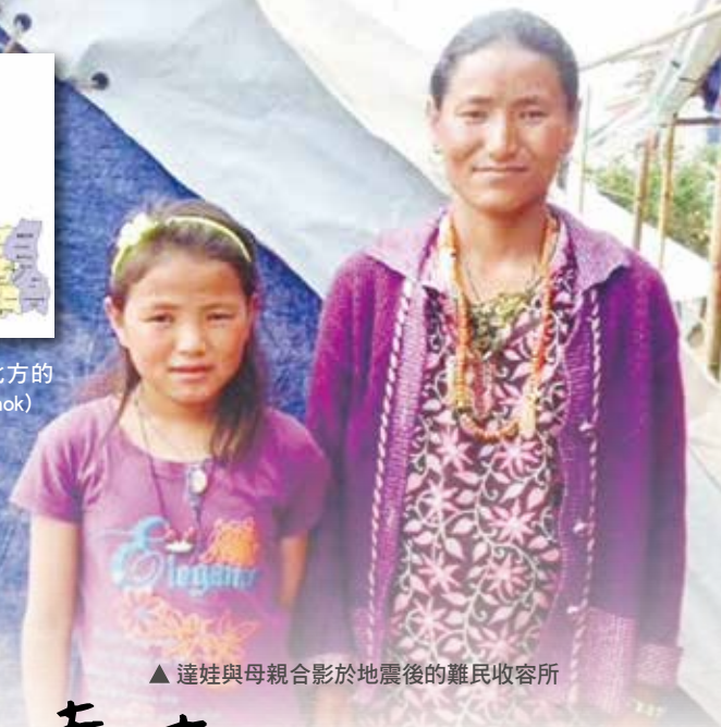
▲ 達娃與母親合影於地震後的難民收容所