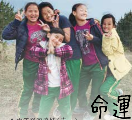
▲ 兩年後的達娃 (左一) 與育幼院童外出踏青