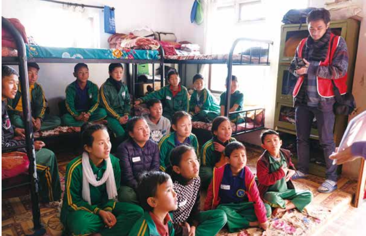
▲ 當初在加德滿都租賃的房子，現在可說是大家都擠在一起，圖中是最大的活動客廳是起居室，也是吃飯和讀書的場所。

自 2011 年開始，環宇基金會即開始駐足尼泊爾，並逐一展開各項服務，包括助學計畫、醫療服務、校舍整建、教育營隊等。