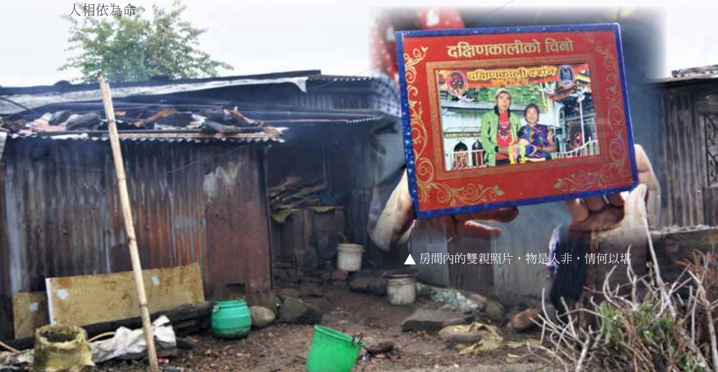
▲ 房間內的雙親照片，物是人非，情何以堪

三個月後法院宣判，父親被判刑 20 年，沒想到父親卻在當天自縊。他們萬萬沒想到，判決那天是他們見父親的最後一面！命運多舛，如今兩姊妹已經頓時成為孤兒了，倘若思念父母，只能靠著手中的照片想念，處境令人心疼。